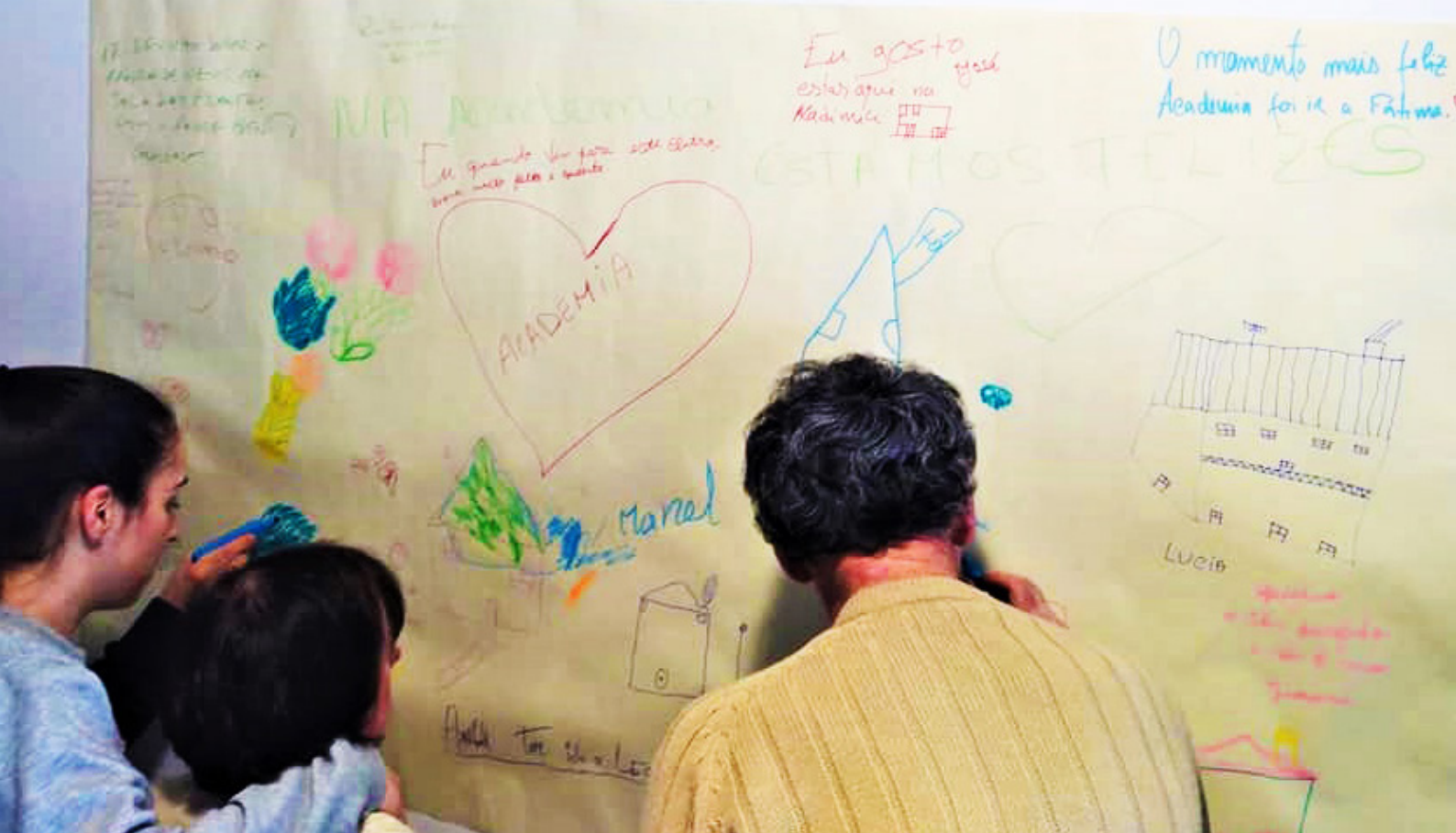
We reflected on the art needed survive and participate in our society.